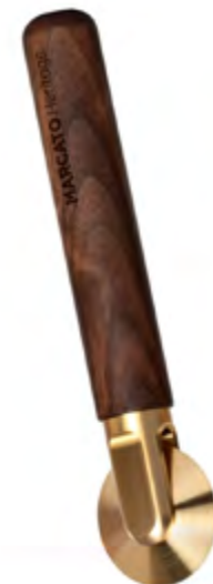
La Rotella Liscia Smooth wheel cutter