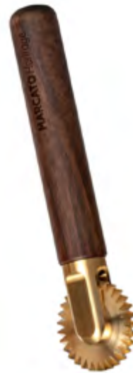
La Rotella Dentata Toothed wheel cutter