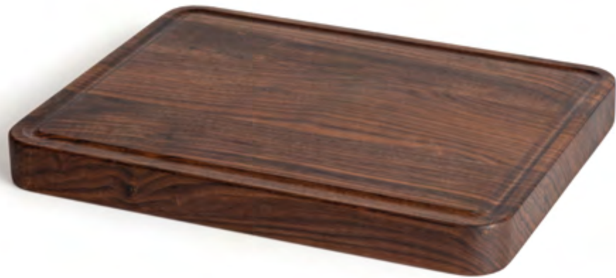
Il Tagliere Cutting board