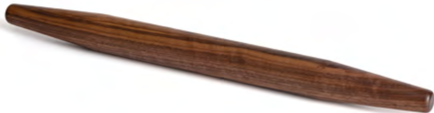
Il Mattarello Rolling pin